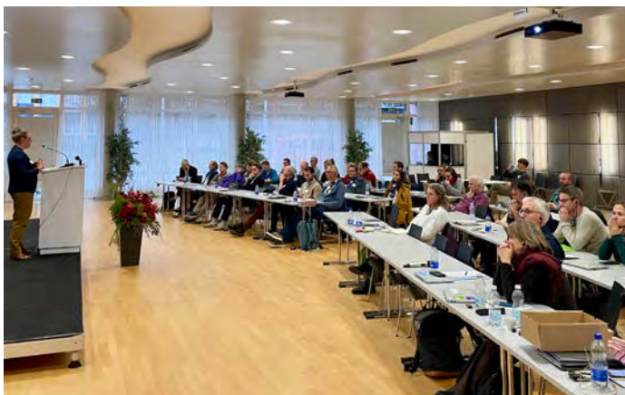
La 1 re rencontre des délégués piétons cantonaux, qui s'est tenue à Ittigen (BE), a été bien fréquentée.

La loi sur les voies cyclables est entrée en vigueur début 2023. Depuis lors, l'OFROU, Mobilité douce, organise la Journée nationale des services vélo. Celle-ci vise, d'une part, à coordonner et à accompagner la mise en œuvre de la loi et, d'autre part, à favoriser une meilleure mise en réseau des spécialistes du domaine du vélo. Au vu de cette expérience positive, le concept a été transposé pour la première fois à la marche en 2025. L'OFROU, Mobilité douce, a mandaté notre association professionnelle pour organiser la première rencontre nationale des délégués piétons cantonaux. L'objectif principal de cette manifestation, bien fréquentée, était de faire progresser la mise en œuvre de la loi sur les chemins pour piétons et les chemins de randonnée pédestre (LCPR), près de 40 ans après son entrée en vigueur, dans les cantons et les communes. Les discussions nourries ont principalement porté sur les opportunités et les avantages de la planification des réseaux piétons.