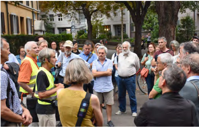
La promenade urbaine a commencé à la Röntgenplatz de Zürich