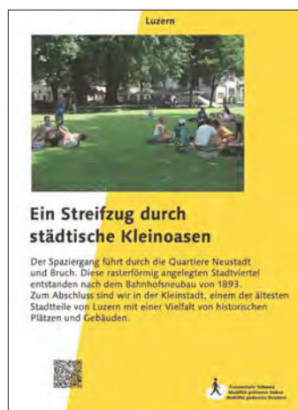
Promenade à Lucerne

À l'occasion des 50 ans de Mobilité piétonne Suisse, les groupes régionaux et les sections ont préparé, dans leur région, des promenades considérées comme particulièrement intéressantes. Il ne s'agissait pas en premier lieu de promenades touristiques, mais plutôt d'itinéraires peu connus ou de chemins présentant des caractéristiques particulières : joyau caché d'un quartier, liaison méconnue, chemin peu exposé au trafic, promenade sans traversée de route, etc. Autant de promenades à découvrir par soi-même.