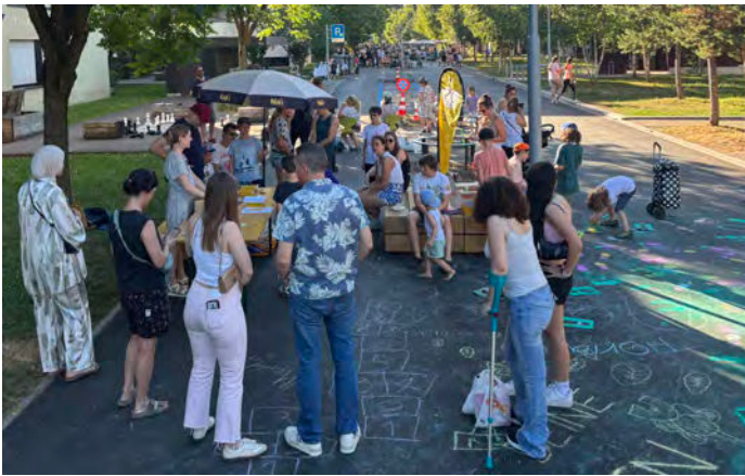
Fête d'inauguration de la Katzenbachstrasse réaménagée : Mobilité piétonne Suisse y tenait un stand participatif pour recueillir les idées d'amélioration.

Deux projets se sont penchés sur la manière d'insuffler davantage de vie aux zones de rencontre. La Katzenbachstrasse à Zurich-Seebach a été réaménagée en 2025 et transformée en zone de rencontre. La coopérative d'habitation Glattal, propriétaire du lotissement adjacent, souhaite saisir cette opportunité pour renforcer l'occupation de l'espace-rue. Des possibilités d'amélioration ont été explorées dans le cadre d'une démarche participative. Lors de la fête d'inauguration, et au cours de divers ateliers, des idées de mesures de valorisation simples ont été élaborées, comme des peintures au sol et davantage d'offres de jeu pour les enfants.