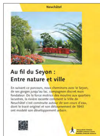
Promenade à Neuchâtel

Parallèlement, une gamme de produits « Mobilité piétonne Suisse » a été créée : des sacoches élégantes, des chaussettes et des lacets originaux arborant le logo de l'association ou encore des post-its pleins d'humour rappelant qu'il faut laisser les trottoirs libres. Tous ces articles peuvent être commandés en ligne.