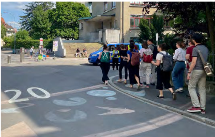
À Berne, les zones de rencontre constituent des points de départ pour les superblocs.

Les superblocs de Barcelone ont suscité un vif intérêt. Ce modèle est désormais appliqué dans de nombreuses villes à l'échelle internationale, et, en Suisse aussi, des projets pilotes sont en cours de planification. Afin d'explorer le potentiel des superblocs, mais aussi de mettre en réseau les personnes intéressées et les spécialistes, Mobilité piétonne Suisse a organisé une série de manifestations en 2025. La diversité des thèmes abordés et l'impression produite par les exemples présentés lors des deux webinaires étaient remarquables ; à Berne, il a en outre été possible d'étudier des développements récents sur place. Il est ainsi clairement apparu que les superblocs ne sont pas de simples instruments de modération du trafic, mais bien un outil flexible de développement urbain, englobant des thématiques telles que voisinage, climat, biodiversité, santé, mobilité, sécurité, participation et activités économiques. Du point de vue de Mobilité piétonne Suisse, les efforts consacrés à l'organisation de cette série de manifestations ont valu la peine, car elle a suscité un très vif intérêt. Ce thème sera donc également suivi en 2026.