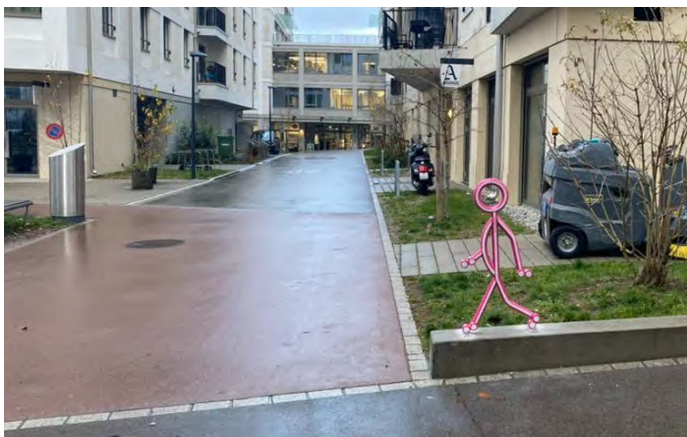
Une silhouette « Pietro » indique désormais quel groupe d'usagers et d'usagers de la route est privilégié.

Le quartier Glasi à Bülach est un vaste ensemble bâti, occupé depuis 2022, où les rues sont signalées comme zones de rencontre. Bien que plusieurs parkings soient disponibles, le stationnement sauvage est fréquent dans le périmètre. Une démarche participative a permis d'élaborer un concept d'animation du quartier (enquête, réunions d'information et flyers, modification du régime de stationnement, action « journées sans voiture », mesures d'aménagement simples).