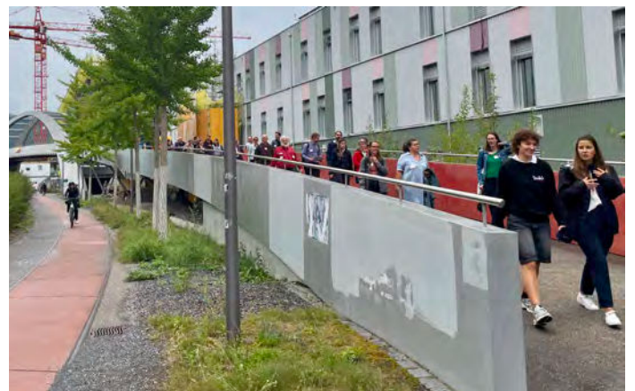
Des walkshops ont permis de découvrir plusieurs aménagements intéressants à Zurich-Ouest.

La marche gagne en importance en tant que forme de mobilité fondamentale et contribution essentielle à la qualité de vie dans les espaces urbanisés. Dans la pratique, c'est-à-dire lors de la mise en œuvre de projets concrets en faveur de la mobilité piétonne, des difficultés surgissent toutefois régulièrement : bien que développement des réseaux piétons et infrastructures piétonnes plus attrayantes soient souhaitables, leur réalisation reste difficile, et le tournant de la mobilité visé, dans lequel la marche joue un rôle central, s'avère complexe malgré sa nécessité. Dans le cadre de la journée d'étude, la question de savoir comment positionner la marche à l'avenir afin d'en renforcer l'importance a été examinée. Des approches prometteuses venant de Suisse et de l'étranger ont été présentées, comme le « Masterplan Gehen » autrichien (éléments d'une politique moderne de promotion de la marche dans le Bade-Wurtemberg) ou encore les étapes de mise en œuvre d'un Paris plus favorable aux personnes à pied.