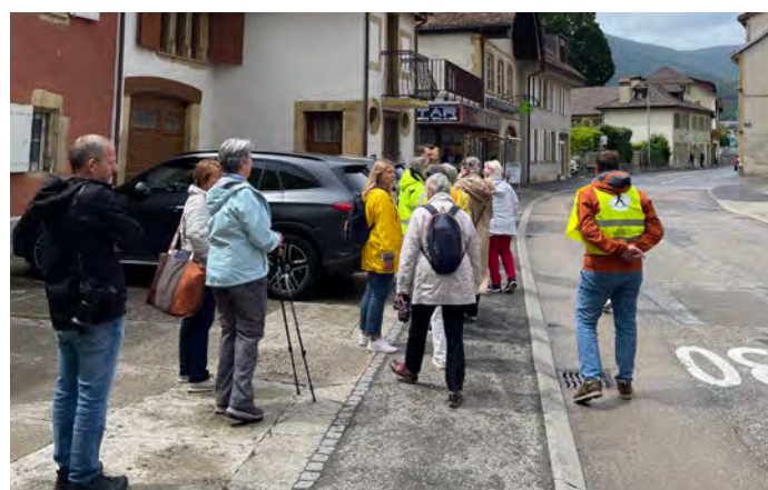
Promenade diagnostique collective dans la commune de Boudry.