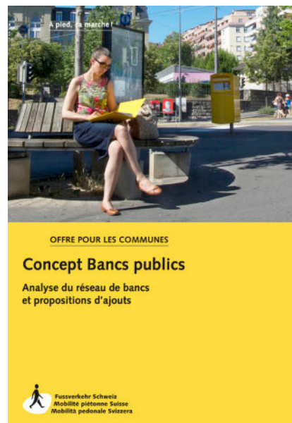
III. 6 – Les concepts de bancs analysent les possibilités de séjour dans les zones d'habitation et de loisirs de proximité.

La qualité de séjour est un facteur important pour promouvoir les déplacements à pied au quotidien et pour les loisirs. L'analyse du réseau de bancs 4 est un exemple d'accompagnement des communes qui permet d'améliorer non seulement les conditions de marche, mais également les possibilités de séjour dans l'espace public. Les bancs font en effet partie intégrante du réseau piéton et revêtent une fonction importante de délasserment et de détente (Mobilité piétonne Suisse 2019). Ils répondent en particulier au besoin des seniors de se reposer à intervalle régulier lors de leurs déplacements et de participer à la vie publique jusqu'à un âge avancé. Les communes qui offrent suffisamment de possibilités de séjour et qui aménagent les assises de manière judicieuse encouragent la marche proche des zones d'habitations.