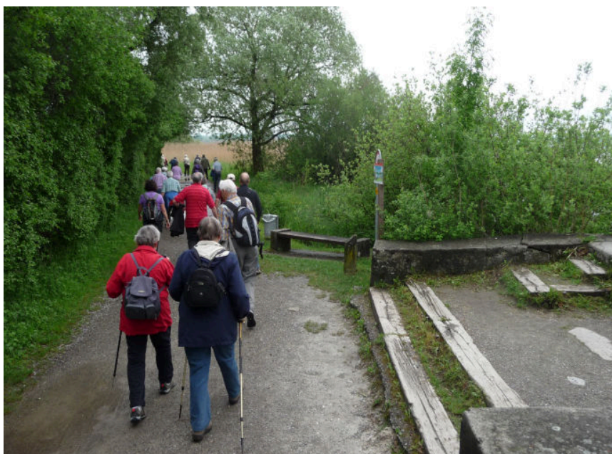
Ill. 5 – Greifensee : chemins très fréquentés dans l'agglomération zurichoise.

Bien que des mesures fortes soient parfois indispensables, il est primordial que les communes compétentes et les associations d'intérêts mettent en place une gestion proactive des espaces de loisir par des mesures de prévention favorisant la prise de conscience (sensibilisation par des « ambassadeurs » sur place, offre d'itinéraires guidés de découverte, etc.). L'objectif est ainsi de permettre à la population de se promener près de chez elle et de faire l'expérience de la nature, tout en la préservant suffisamment.