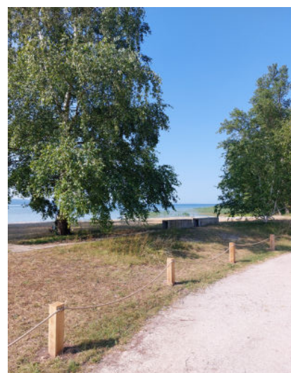
III. 4 – Préfargier (commune de la Tène) : mesures prises le long du sentier du lac pour signaler les espaces privés (© Canton de Neuchâtel).