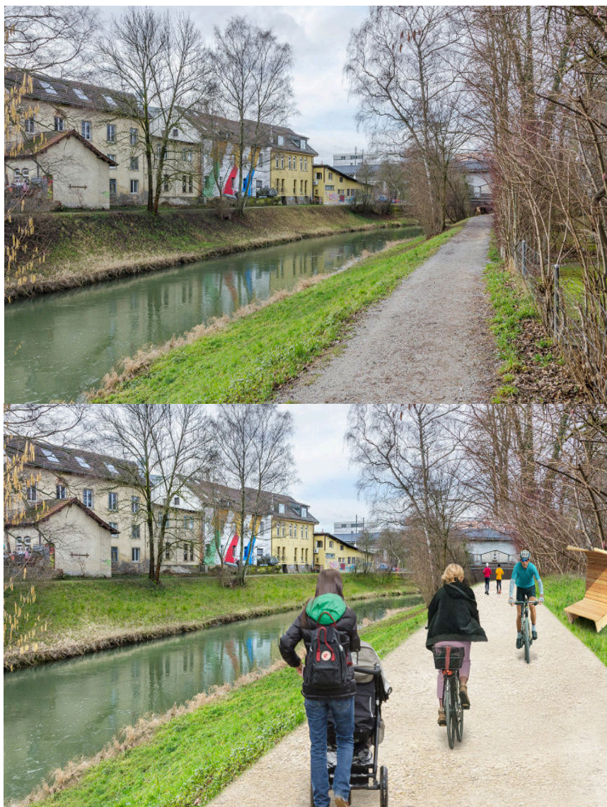
III. 3 – Zurich : chemin des rives de la Glatt avant et après (photo de synthèse) l'élargissement du chemin.

La question de la coexistence des piéton·nes et des cyclistes sur les voies vertes nécessite une réflexion profonde sur la manière dont on veut les aménager et sur le public pour lequel on veut les aménager. De telles réflexions méritent d'être relevées, car elles permettent de saisir des opportunités en dehors des localités. L'aménagement de voies partagées piétons-vélos devrait toutefois être évité autant que possible à l'intérieur des localités.