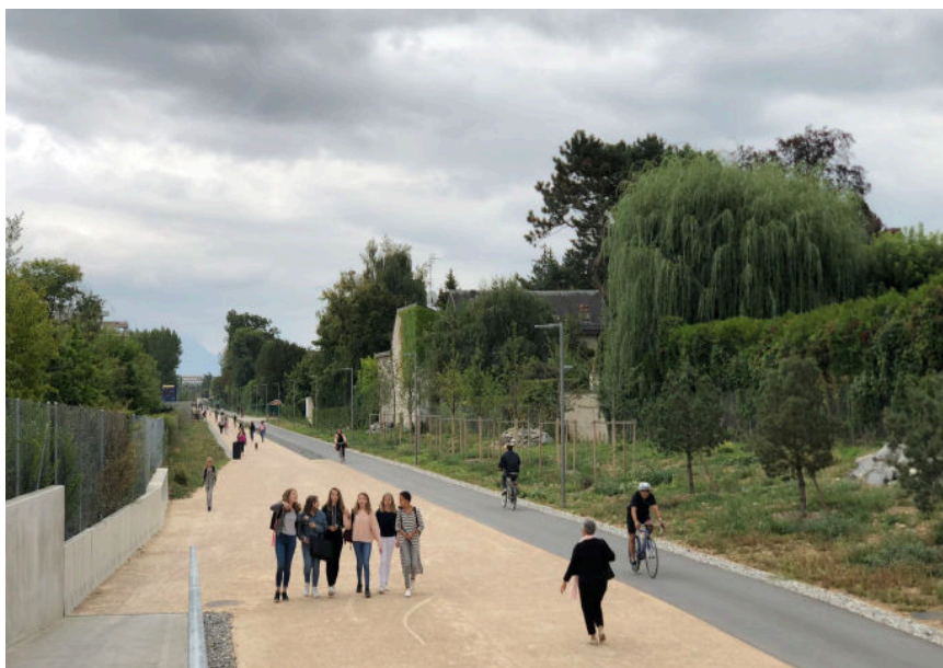
Ill. 2 – Genève : voie verte partagée entre piéton·nes et cyclistes.

Les voies vertes, qui sont un type d'aménagement réservé aux modes actifs destiné tant à la marche de loisirs qu'à la mobilité utilitaire, impliquent une réflexion sur la cohabitation entre cyclistes et piéton·nes et donnent des pistes de solution (Mobilité piétonne Suisse 2018).