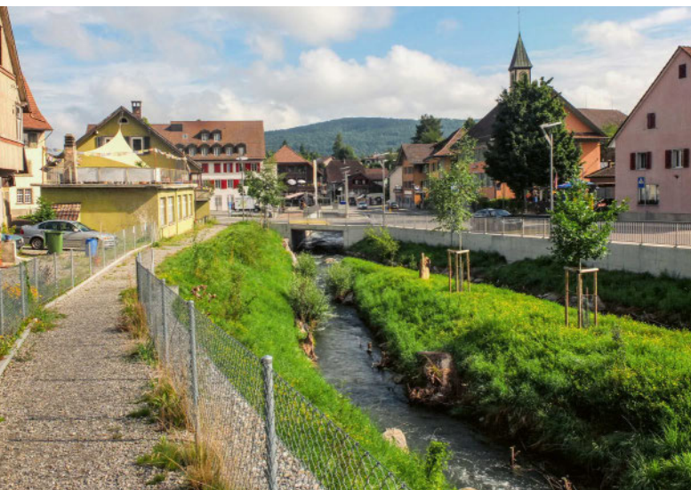
Un nouveau chemin rapproche les piétons du ruisseau réaménagé.

Niederlenz (AG) a réussi l'assainissement d'une route cantonale scindant en deux un village, redonné de la visibilité au centre et l'a rendu attractif pour les piétons. La solution a été récompensée par une distinction.